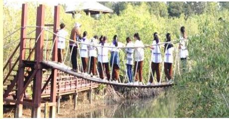
ณ อุทยานสิ่งแวดล้อมนานาชาติ จ.เพชรบุรี