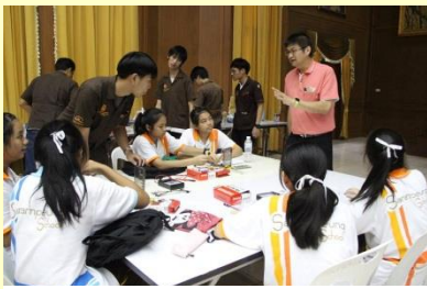
อบรมเรื่อง Basic electronics