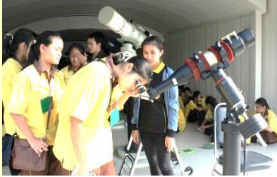
ค่ายค้นฟ้าคว้าดาว ณ หอดูดาวเฉลิมพระเกียรติ จ.นครราชสีมา