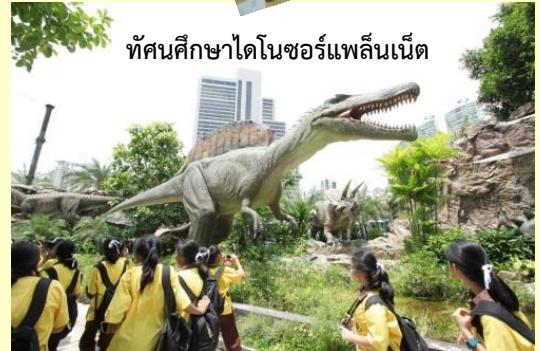
ทัศนศึกษาไดโนซอร์แพลนเน็ต